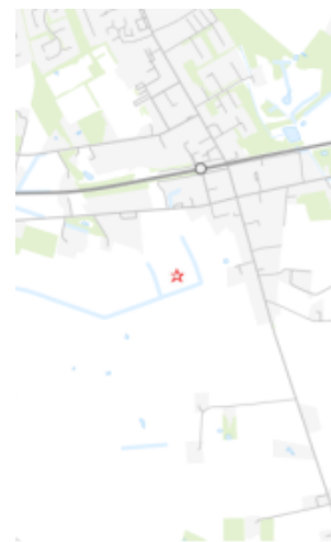
Område i Gørding Syd til regnvandsbassin.