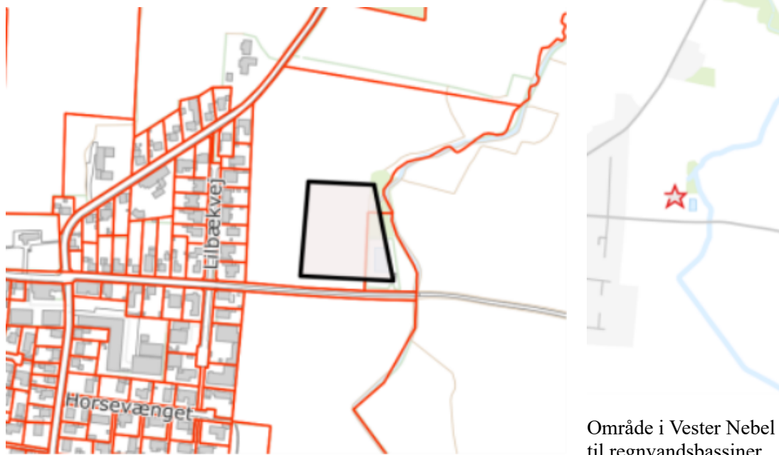
Område i Vester Nebel til regnvandsbassiner.