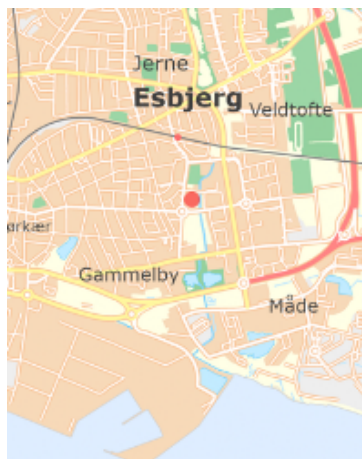
Spektrumparken i Østbyen