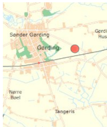
Landområde ved Gørding