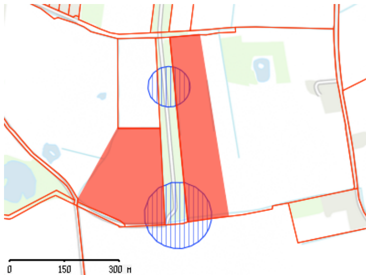
BNBO ved Lustrup/Strengvej.