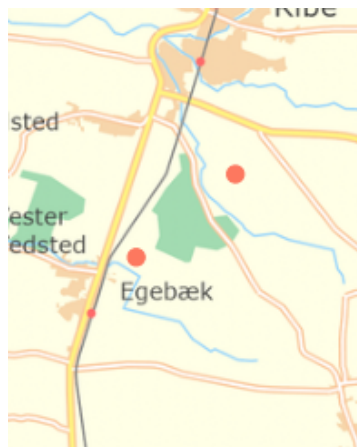
Aftale-områderne, syd for Ribe