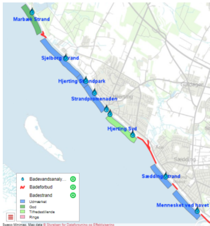
Figur 2. Klassifikationer for strande i badesæson 2022.

Efter sæsonen 2021 er badevandet klassificeret som på nedenstående figur 2.