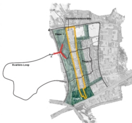
Illustration Stengårdsvejskvarteret i Esbjerg De tre etaper i fase 4

Der er nedsat en projektgruppe sammen med Ungdomsbo. Projektgruppen har medlemmer fra alle forvaltninger, bydelsprojekt 3i1 samt Syd- og Sønderjyllands Politi og Kommunikation for at sikre, at de fysiske projekter understøtter