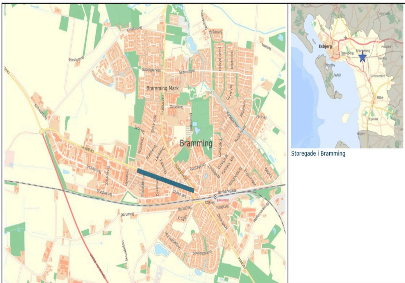
Storegade i Bramming

Plan, By & Lokalsamfundsudvalget skal tage stilling til, om det skal indstilles til Byrådet at frigive en projekterings- og anlægsbevilling, således detailprojektering, arealerhvervelse og anlæg kan påbegyndes.