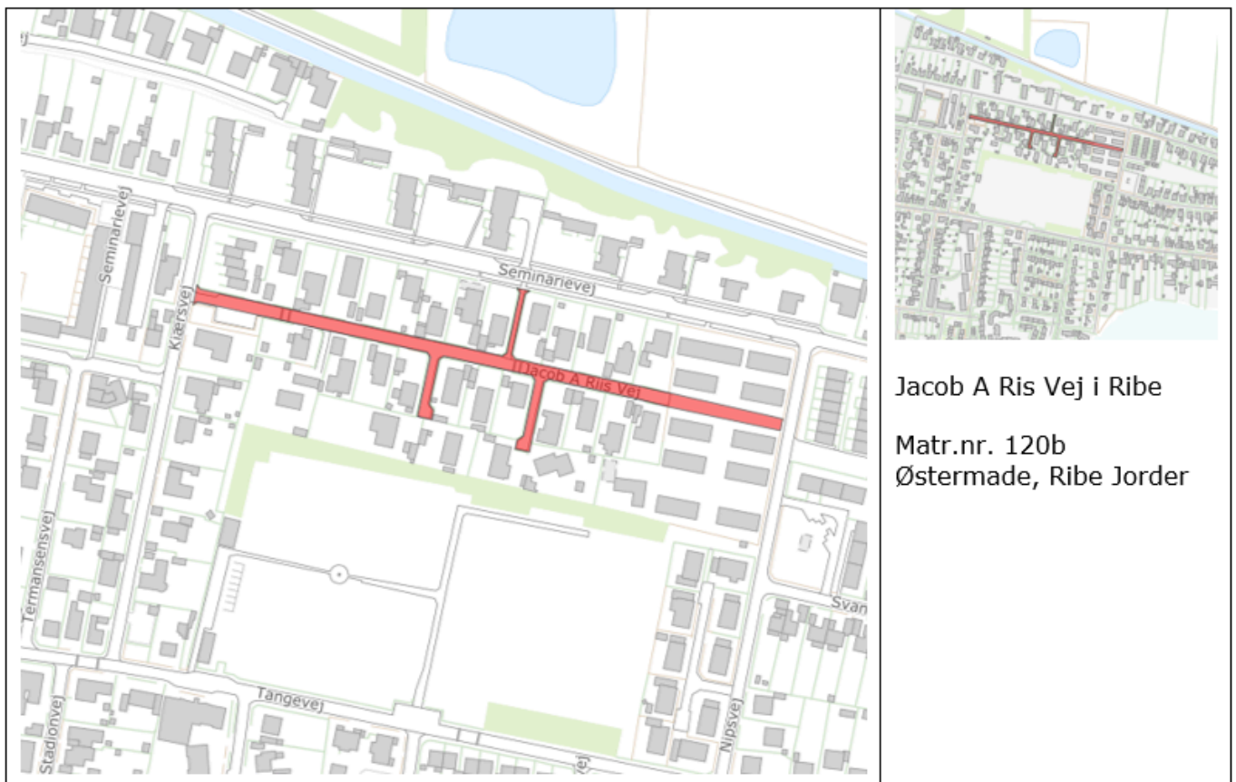
Jacob A Riis Vej i Ribe

Baggrunden for anmodningen er, at vejarealet omfatter hele Jacob A. Riis Vej i Ribe, og at vejen dermed også fungerer som adgangsvej for de private boliger på strækningen.