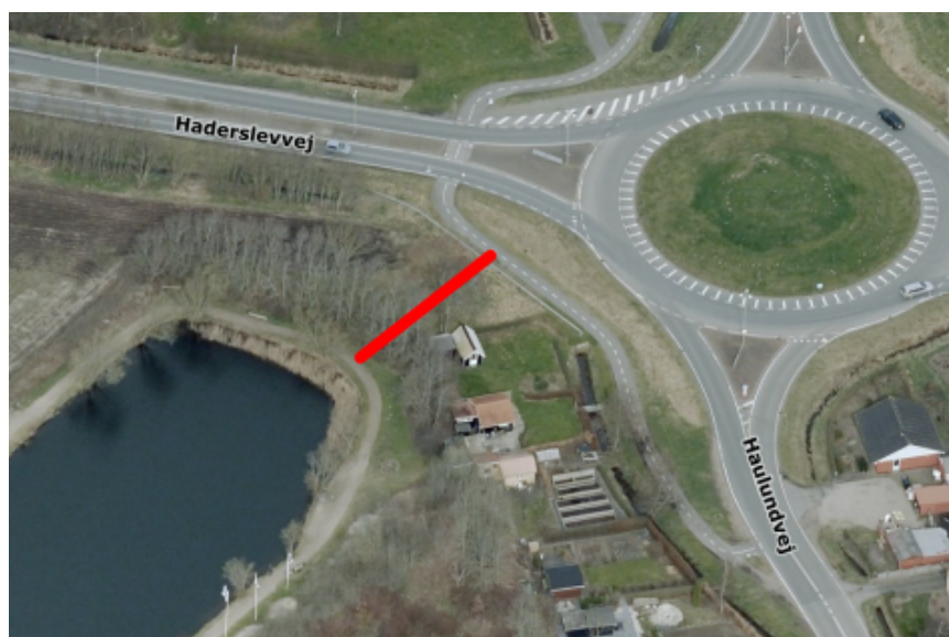
Figur 3 Mulighed for etablering af sti