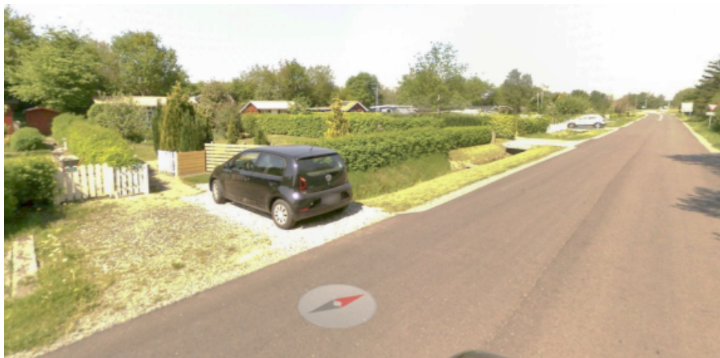
Figur 2 Haulundvej set fra syd

Der har tidligere været belysning på træmaster på strækningen. Belysningen blev fjernet i forbindelse med en servicereduktion i 2010/2011.