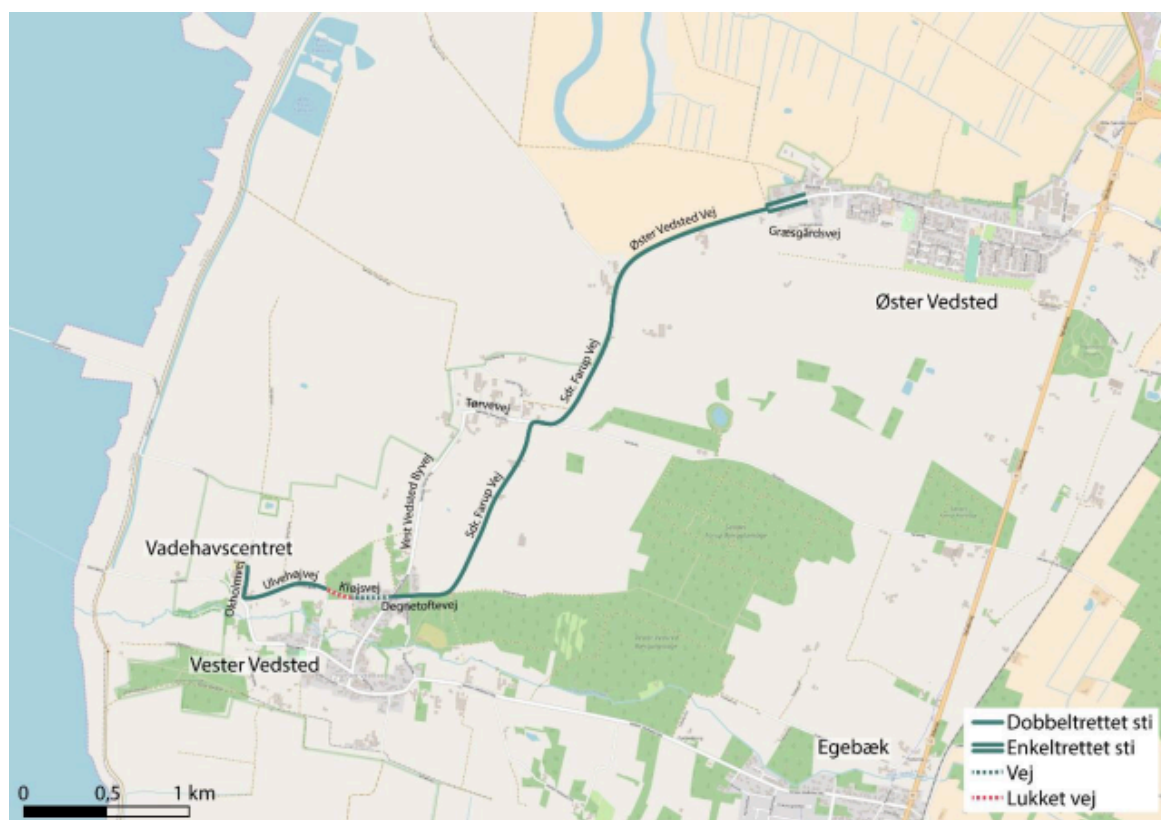
Cykelstiens forløb mellem Vester Vedsted og Øster Vedsted

Esbjerg Kommune søgte i 2017 om støtte til etablering af en 5 km lang 2,5 meter bred dobbeltrettet cykelsti fra Vadehavscentret i Vester Vedsted, over Sdr. Farup til Øster Vedsted. Der er eksisterende stiforbindelse fra Øster Vedsted til Ribe.