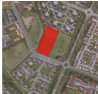
Langliparken, Hjerting, 6710 Esbjerg v

Del af matr.nr. 3bo Hjerting By, Guldager