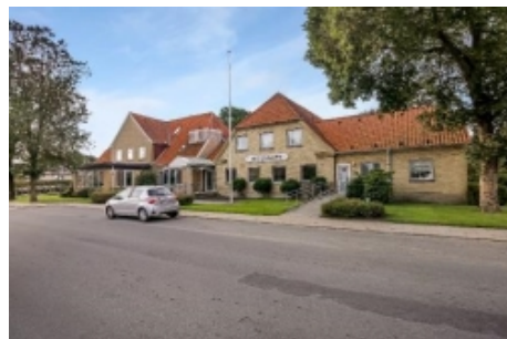
Lindegården 1-13 6690 Gørding.