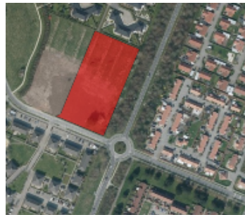
Langliparken, Hjerting, 6710 Esbjerg v