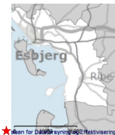
Hunderup Sejstrups placering, centralt i Esbjerg Kommune