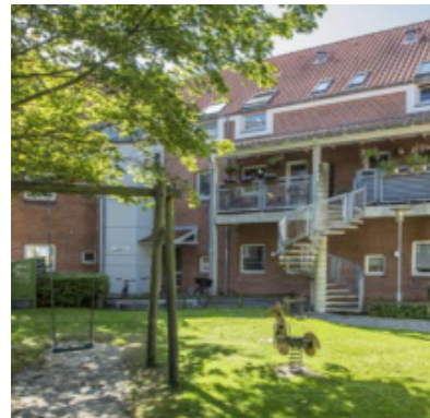
Islandsgade 54-62 og Strandbygade 13 6700 Esbjerg.

18 Familieboliger og 6 ungdomsboliger opført som etagebyggeri.