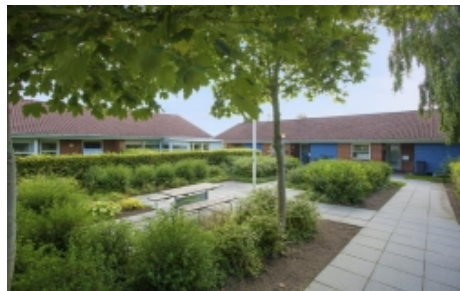
Mellemvangs Alle 1A-3E, 6705 Esbjerg Ø, og Sønderled 2-12, 6731 Tjæreborg.

15 Ældreboliger opført som etplans boliger.