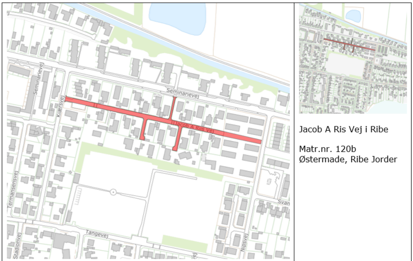
Jacob A Riis Vej i Ribe

Baggrunden for anmodningen er, at vejarealet omfatter hele Jacob A. Riis Vej i Ribe, og at vejen dermed også fungerer som adgangsvej for de private boliger på strækningen.