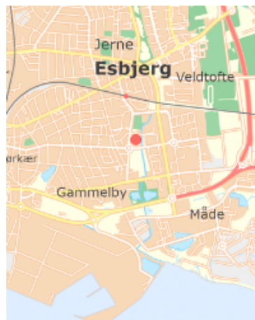
Spektrumparken i Østbyen