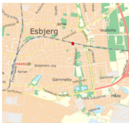
Ny Jerne nærbanestation med forplads