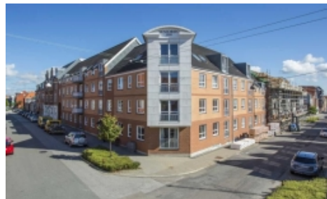
Finsensgade 7, 6700 Esbjerg.

23 Familieboliger opført som etagebyggeri.