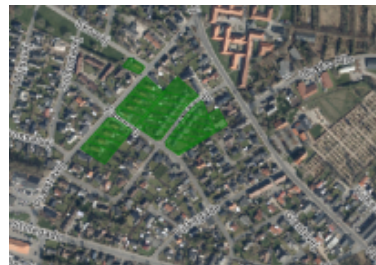
Præstevej 9-25 og 12, Lærkevej 5-15 og 6-18 i Bramming