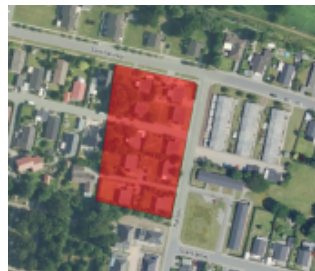
Matr.nr. 119g, Østermade, Ribe Jorder

Boligareal 830 m 2 i forhold til helhedsplan og 965 m 2 i forhold til nybyggeridelen.