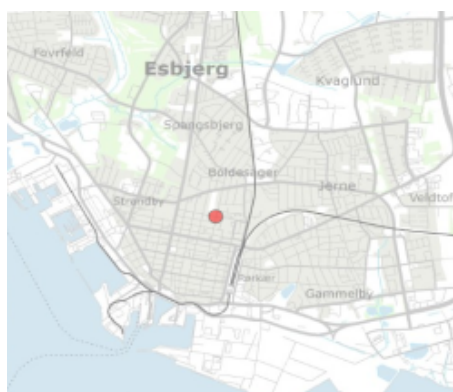
Placering af vejkrydset Torvegade/Haraldsgade i Esbjerg