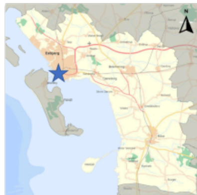
Geografisk placering af projektet, hvor der planlægges krydsombygning