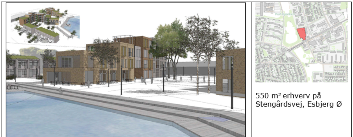
Ikke nødvendigvis ajourført og målfast. Ingen retslydighed.

Såfremt byrådet godkender dette dagsordenspunkt, vil der når byggeriet er opført blive indgået en lejekontrakt med Esebolig.