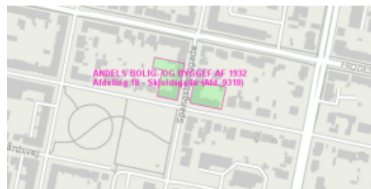
Afdeling 18 – Skjoldsgade/Spangsbjerggade, 6700 Esbjerg