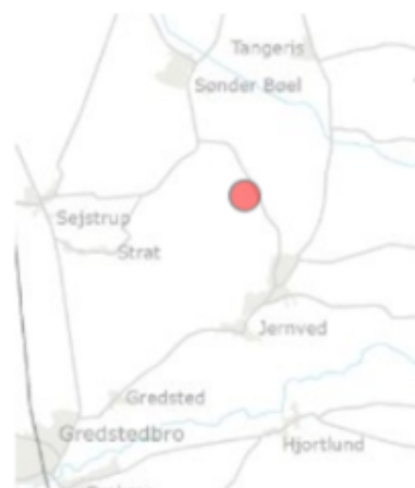
Puggårdsvej 64 6771 Gredstedbro